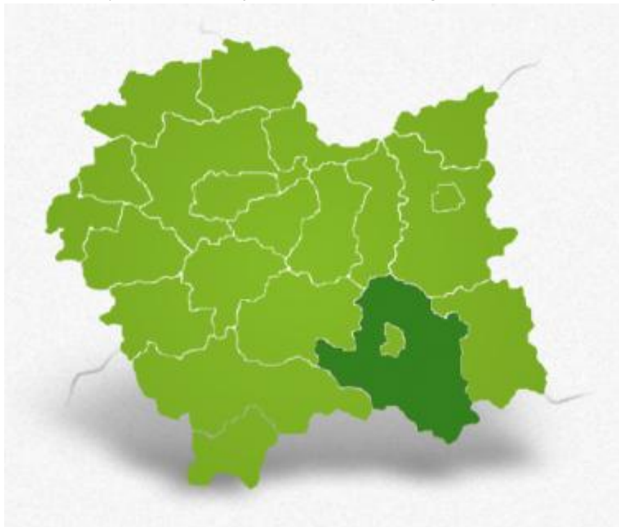
Rysunek 2. Powiat Nowosądecki z na tle województwa małopolskiego.