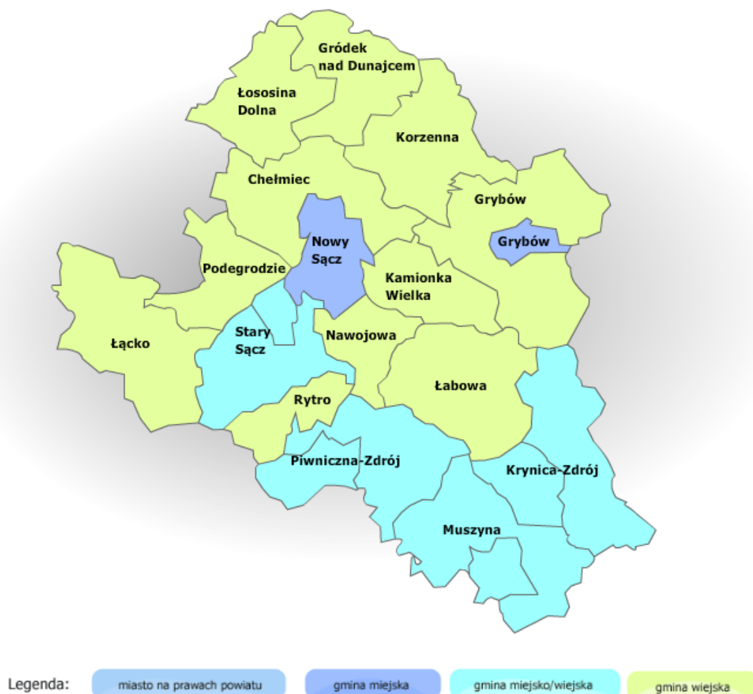
Rysunek 1. Powiat Nowosądecki z podziałem na gminy.