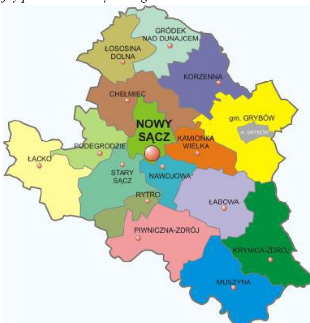
Mapa 1. Podział administracyjny powiatu nowosądeckiego.

Największą częścią powierzchni powiatu nowosądeckiego zajmują kolejno: Gmina Grybów, Gmina Krynica - Zdrój oraz Gmina Muszyna, zaś najmniejszymi jednostkami są: Miasto Grybów oraz Gmina Rytró.