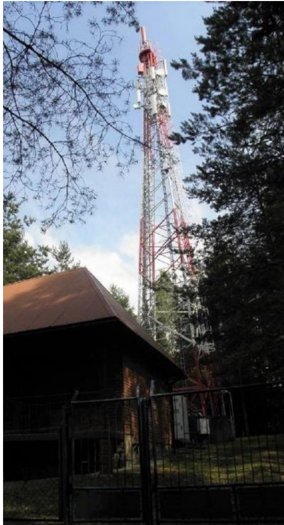
Fot. 1. TSR Żegiestów Wieś / g. Cypel – widok obiektu