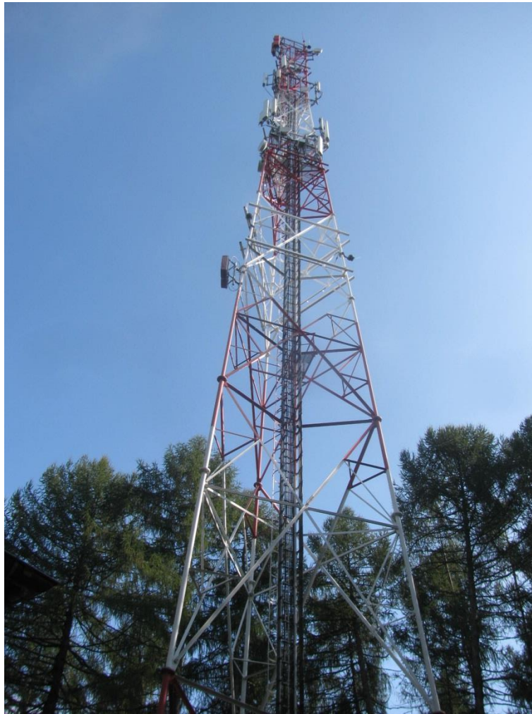
Zaf. nr 1: Widok ogólny instalacji radiokomunikacyjnej.