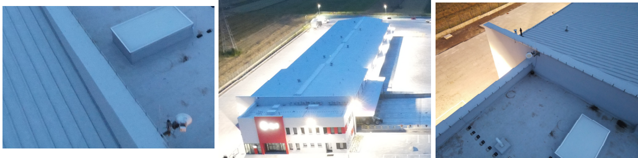
Tabela nr 6

Widok obiektu wraz z zainstalowanym zespołem antenowym