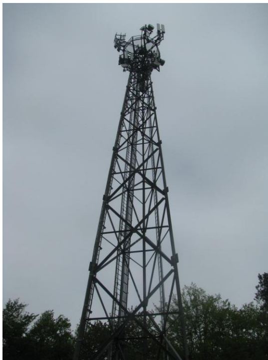
Zał. nr 1: Widok ogólny instalacji radiokomunikacyjnej.

Koniec sprawozdania. Sprawozdanie zawiera dodatkowo załączniki nr 1 i 2.